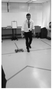
ポッチャ体験交流会

事務局職員等は、パラスポーツポッチャ体験交流会を行いました。抽選でチームを作り各島の職員同士の交流会が