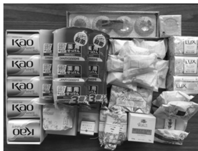
石けんもたくさん頂きました。良い香り♪