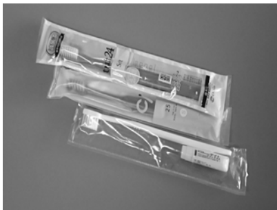
未使用歯ブラシ217本

昨年度、椿の実と一緒に袋に入っていた手紙です。とっても嬉しかったです。ありがとうございました！