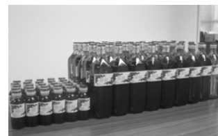
平成29年販売した椿油