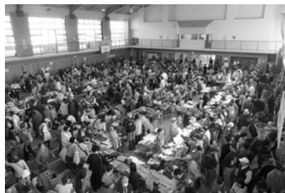
—昨年度のバザーの様子