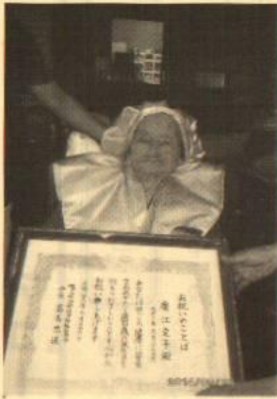
当日の定子さんの様子