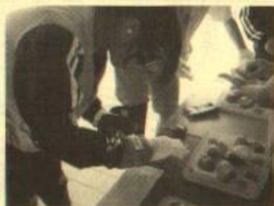
〈買い物でお金を払う体験〉 小銭を広げ探している様子 皆さん一番苦労していました

このように、実際体験をして高齢者特有の日常を学ぶことで、高齢者の立場になって考える気持ちを育てられたかと思えます。