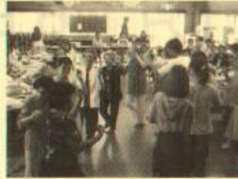
楽しい宴のお開きはみんなでシヨメ節

末吉の敬老会は、48名の方が参加しました。こちらも大学生のボランティアが来てくれて、準備片付けだけでなく、料理を運んだり参加者と一緒に席に座ってお話をしたり、カラオケに参加しました。参加者も「普段は若い方とあまり話さないから、こういう機会にお話しできてうれしい」と会話を楽しんでおられました。