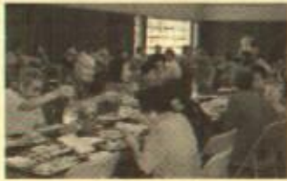
楽しい宴のはじまりはみんなでカンパニー!

また、敬老の日を一緒に祝うため、大賀郷中学校の生徒による合唱や、婦人会の踊りが演じられました。参加者のカラオケもあり、大いに盛り上がりました。