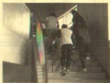
〈階段を上がる体験〉