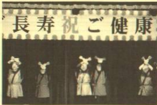
婦人会有志による 「よさこいソーラン節」

去る6月8日に三根地域の敬老会が行われました。参加者は300名で、食事の後の余興では今年初参加の方の踊りやカラオケなど、約2時間にわたり、大変盛り上がりしました。