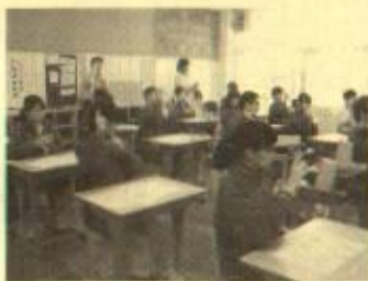
一三原中手話体験の様子一

三原中学校と三根小学校の総 合的学習の時間に、スクール出 前に出かけました。 三原中学校2年生は、まず始 めに足が不自由な人との交流に 備え、車いすで段差などの介助 の仕方を練習しました。介助さ れる側、する側を体験すること で車いすを介助する際に必要な ことを学びました。 また、耳の不自由な人とのコ ミュニケーションの方法として 手話を使って挨拶の練習をし り、自分の名前を表し方を学び 発表し、最後に手話歌を練習し ました。 短い時間でしたが、少しでも 障がいのある人達について理解 するきっかけに出来たら良いと 思いました。 三根小学校は5月から6月に かけて、スクール出前を4回行 いました。内容は、障がいがあ る方の理解や高齢者の理解など です。詳しい内容は、次回報告 します。